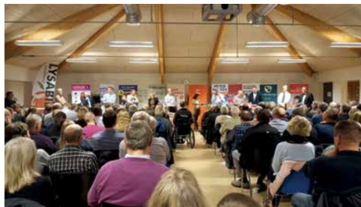
Landsbyrådene takker for den overvældende opbakning, der var til vælgermødet på Lysabild Skole den 9. november.

Alle arrangementer foregår i LSG's Klubhus kl. 13.30 hvis ikke andet er nævnt.