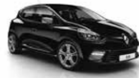
Renault Clio årgang 2018