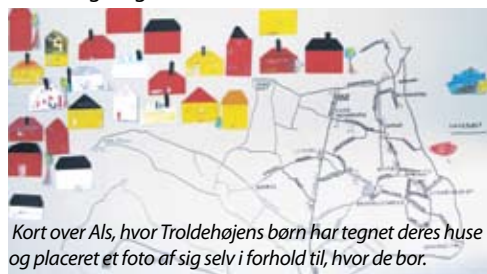
Kort over Als, hvor Troldehøjens børn har tegnet deres huse og placeret et foto af sig selv i forhold til, hvor de bor.

Målet med projektet er, at børnene får mulighed for at afprøve forskellig slags maling på forskelligt materiale, at udtrykke sig og sætte ord på det, de tegner/maler og at opleve glæden ved selv at male og male sammen med andre. "Maleprojektet" afsluttes med en fernisering, hvor børnene viser deres tegninger/malerier frem for forældrene.