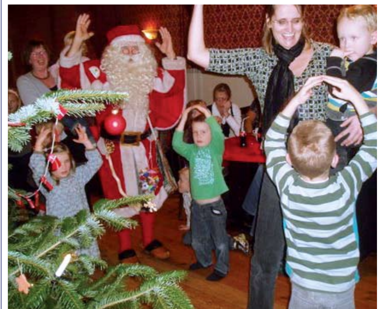
Juletræsfeest på Skovby Kro 2008

I november havde Lysabild's 7 dagplejere besøg af Gymnastik Karavanen. Der var masser af inspiration til nye aktiviteter, når dagplejere og børn én gang om måneden mødes i skolens gymnastiksal til motion og sjov. Vi dagplejere fik nye idéer til sang og bevægelse - ja selv et simpelt dynebetæk kan give meget sjov!