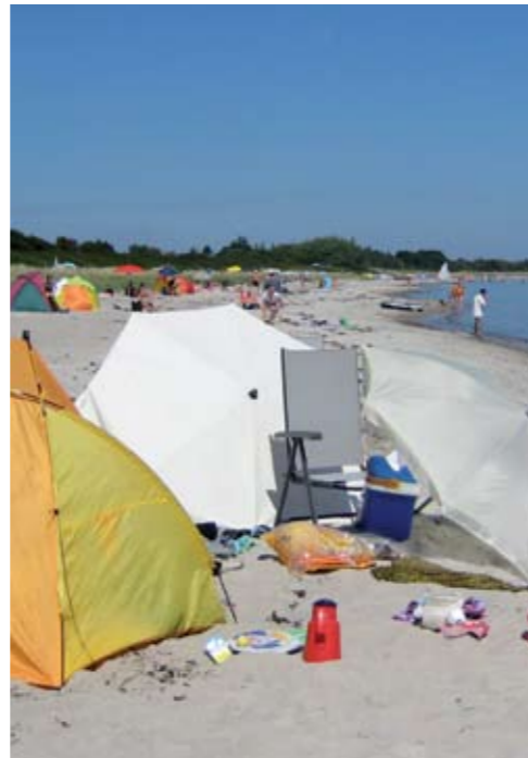
Sommerdag på Kærneland