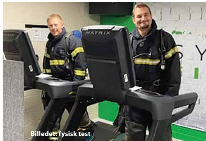
Billedet: fysisk test

Året 2021 har været et normalt år, når vi ser på øvelsesaktiviteter. Der har været en særlig fokus på uddannelsesforløbet for de 5 nye brandmænd, som blev optaget i brandværnet i 2020. De har gennemført og bestået både grunduddannelsen og funktionsuddannelsen i 2021. Det har været et presset program, hvor de rundt regnet har brugt 300 timer fordelt over aftener og weekender.