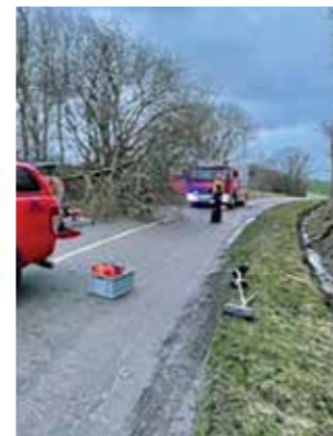
Billeder er fra stormen 29. januar 2022 og røgdykkerøvelse.