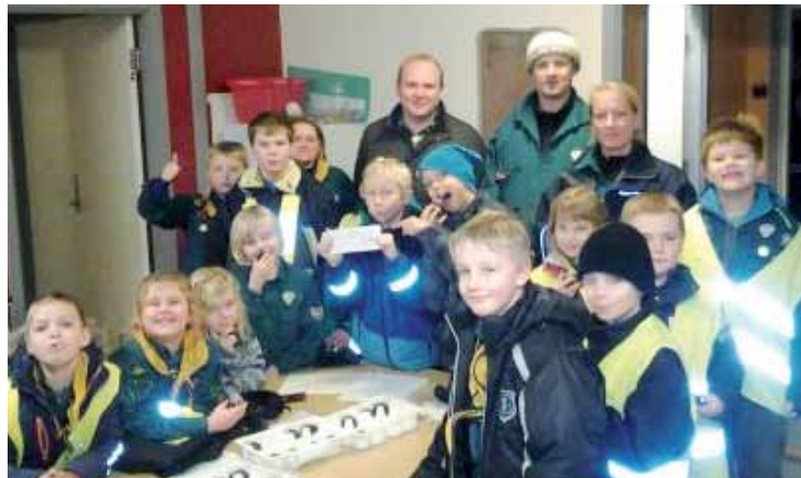
Spejdergruppen modtager et sponsorat på 5.000,- kr. fra Dagli'Brugsen.

KFUM spejderne siger i øvrigt mange tak til Dagli'Brugsen i Skovby, for det meget flotte sponsorat på 5000,- kr., som allerede er øremærket næste års store distrikts lejr. Pengene vil betyde, at forældrebetalingen bliver nedsat, så vi forhåbentlig kan få alle børn med på lejren.