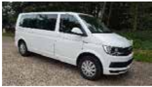
VW Caravelle årgang 2017

Lån den til samkørsel, så sparer I at køre i to biler! Her er plads til 9 personer, og du må køre den på alm. kørekort.